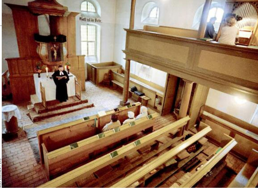
ROLEF ZOLLNER / EPD